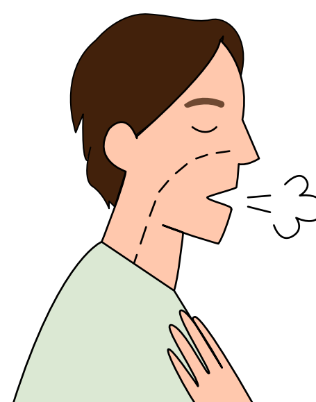
Dificuldade para respirar