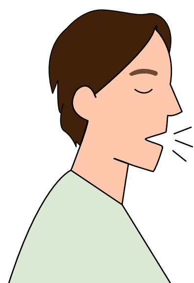
Tosse seca ou com secreção